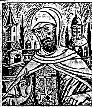
«Έργον ἐκ Μοναχῶν, μετὰ τὸ τυπὸν ἀντίγραφου καινοτομηθέν τὸ Εὐαγγέλιον».